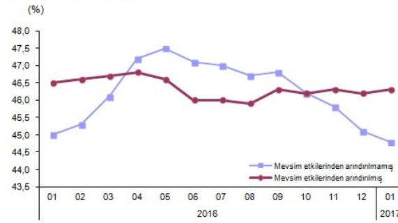
İstihdam oranı, Ocak 2017